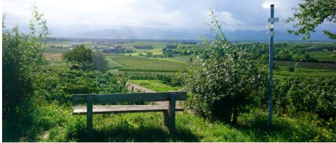
Danach fuhren wir zum Rhein und kämpften uns auf Schotter- und Kiespiste bei extremen Gegenwind nach Breisach. Zum Glück konnten wir die beiden E-Biker der Gruppe als Windschattenspender nutzen. In Breisach war Zwetschkuchen zur Stärkung notwendig und obligatorisch.